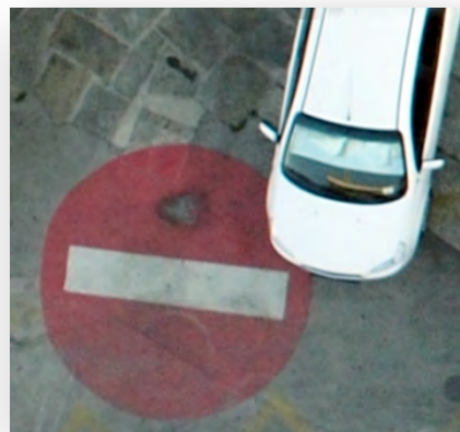
DOF 2 cm