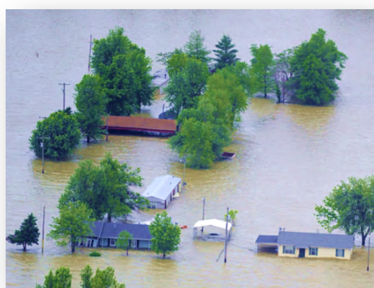
Panoramski posnetki, promocijski video, aktualni posegi v prostor, posledice naravnih nesreč, ...