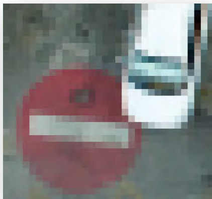
DOF 10 cm