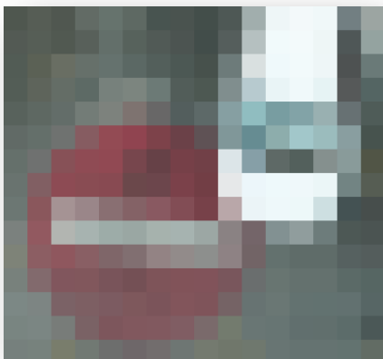
DOF 50 cm