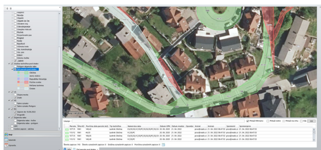
analiza lastništva pod dejansko rabo občinskih cest